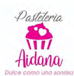
Panadería y pastelería