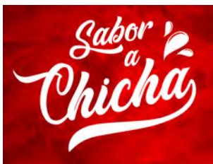
Sabor a chicha