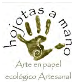
Hojotas a Mano