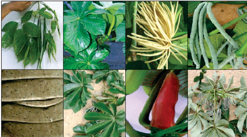
Figura N° 2: De izquierda a derecha: Sparattosperma leucanthum (frutos); Cecropia membranacea (hojas, centro inflorescencia masculina y derecha inflorescencia femenina); Cecropia concolor (tallo, hojas por el haz, estípula terminal y hojas por el envés e inflorescencia femenina).

Euphorbia umbellata (Pax) Bruyns (planta de la vida