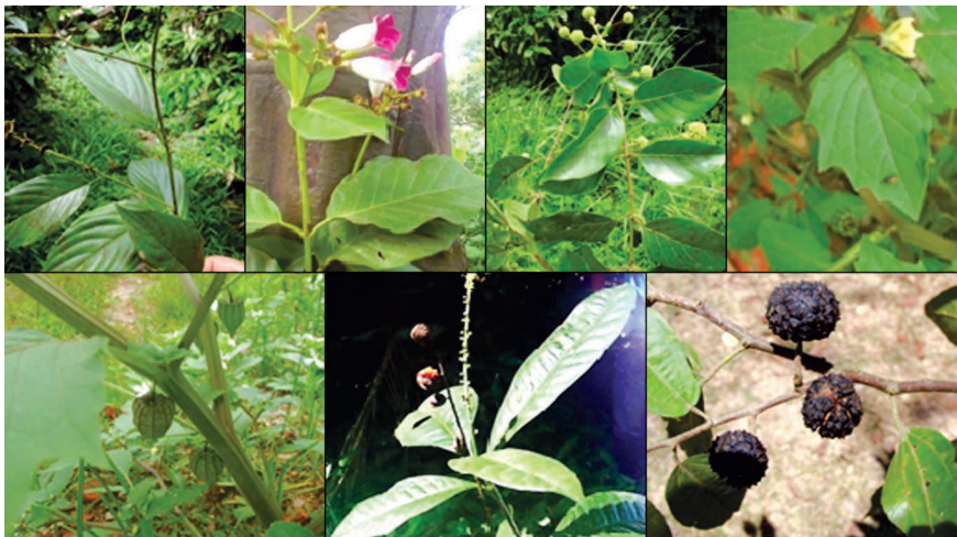
Figura N° 8: Parte superior: Gouania lupuloides ; Capirona decorticans ; Uncaria guianensis ; Physalis angulata en flor; parte inferior izquierda: Physalis angulata en fruto; Pilocarpus peruvianus en fruto; Guazuma ulmifolia en fruto.

Dipteryx odorata (Aubl.) Willd., Tectona grandis L. f., Vitex cymosa Bertero ex Spreng., Virola pavonis (A. DC.) A. C. Sm., Bambusa arundinacea (Retz.) Willd. Ocotea bofo H.B.K., Calycophyllum spruceanum Benth., Capirona decorticans Spruce y Guazuma ulmifolia Lam.: Son especies maderables algunas de las cuales han sido reforestadas y otras han crecido