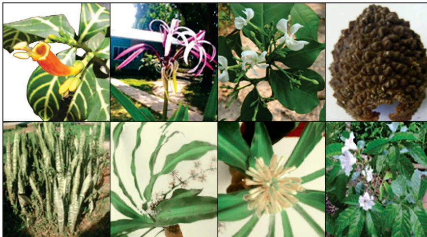
Figura N° 1: De izquierda a derecha: Sanchezia tigrina ; Crinum augustum ; Tabernaemontana heterophylla (flor y fruto); inferior izquierda ( Sansevieria trifasciata ); Dracaena fragrans (inflorescencia y flor); inferior derecha ( Sparattosperma leucanthum ).

Cecropia sciadophylla Mart. (Cetico colorado): Árbol de fuste cilíndrico y recto; ramificación simpodial hasta 25 m de alto, 30-50 cm de diámetro; anillos y aristas semicirculares a todo lo largo del fuste y ramas. Raíces zancos, hasta 1,5 m de alto. Corteza externa lenticelar; lenticelas circulares y abultadas, pardo rojizas.