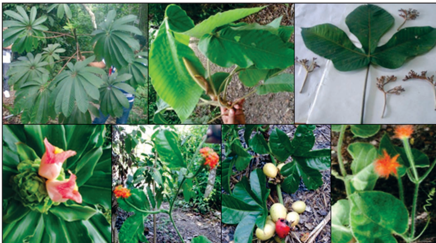
Figura N° 3: De izquierda a derecha: Cecropia sciadophylla ; Hojas e inflorescencias de Pourouma guianensis ; parte inferior izquierda ( Costus guanaiensis ); Cayaponia ophthalmica (inflorescencia y frutos); último derecha ( Gurania eriantha ).