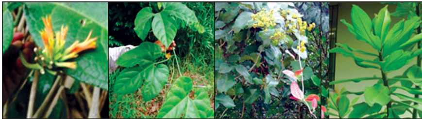
Figura N° 4: De izquierda a derecha: primera y segunda imagen ( Gurania spinulosa ); Davilla nitida (tercera figura); Synadenium grantii (arbusto lado derecho).

la UNU y también en el Bosque CICFOR Macuya que pertenece a la Universidad Nacional de Ucayali, ubicado en el límite entre el departamento de Huánuco y el de Ucayali, entrando por el km 86 de la Carretera Federico Basadre y la Carretera Marginal de la Selva Fernando Belaunde Terry que va al Palcazú.