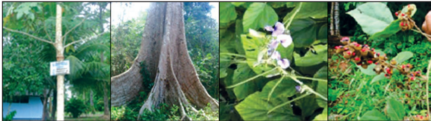
Figura N° 5: De izquierda a derecha: Arbolito en el Campus de la UNU y árbol centenario de Dipteryx odorata en el Bosque CICFOR Macuya; Pueraria phaseoloides ; Rhynchosia phaseoloides (ultima imagen derecha).