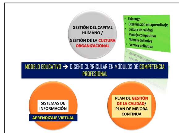
Figura 2. Sistemas básicos para iniciar el cambio en una organización universitaria: sistema de información, SGC, y la gestión de la cultura organizacional.

El Modelo de Licenciamiento tiene como un componente de la Condición I a los Sistemas de información; así