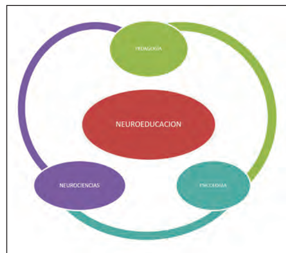
Figura 1. La neuroeducación.

La neuroeducación es uno de los factores que ayudará a mejorar la calidad de nuestros sistemas educativos y promoverá mejores programas de la primera infancia, pero para ello necesitamos repensar el perfil del educador de modo que sepa orientar la transformación.