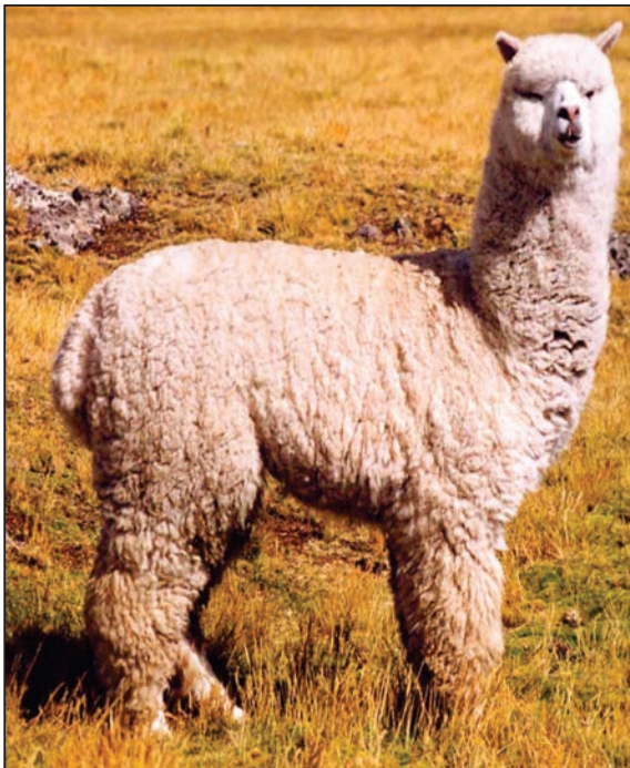
Figura 2. Alpaca de Raza Huacaya ( Lama pacos ) Linnaeus, 1758.

Como se menciona anteriormente los camélidos